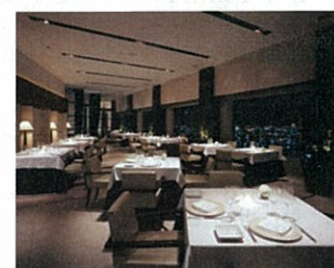
タワーズレストラン「クーカーニョ」

ご滞在中にご利用いただいた対象施設、対象サービスのご利用金額から1室1泊につき上限¥3,000（税金・サービス料込み）分をチェックアウト時に差し引かせていただきます。下記レストランやサービスでのご利用料金に充当いただけます。