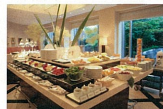
「かるめら」朝食ブッフェ